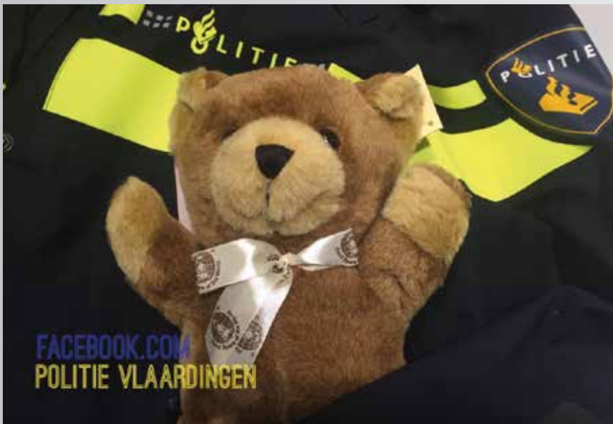
LET OP: Bevat grof taalgebruik

Het is een gewone dinsdagavond ergens aan het begin van de winter. Buiten is het zonnig maar behoorlijk aan de frisse kant, perfect schaatsweer eigenlijk. Samen met een vrouwelijk collega zitten wij op de noodhulpwagen van Vlaardingen.