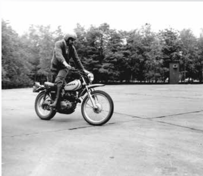
Foto: Motoropleiding Bilthoven. Als je zo met gekruiste benen en helemaal uit evenwicht gebracht, stuur kon houden, was je al aardig vertrouwd met de motor.

We waren de eerste groep van de Rijkspolitie met strandmotoren.